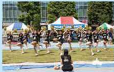
国際大会「スーパーラグビー」に参戦する日本チームサンウルブスのチアリーダーズも活躍