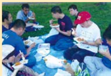
「1日の中のここにいる8時間だけでも楽しく過ごして欲しい」とさまざまな企画を考え、実施しています