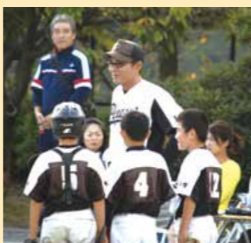
高校時代の守備はサードだったそうです